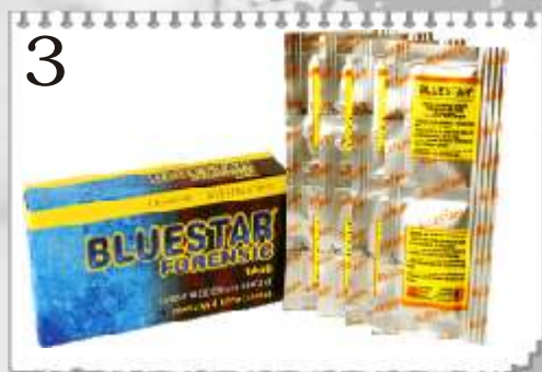
3 9782B : BLUESTAR EN COMPRIMÉS 8 DOSES PRÉPARATION POUR 1 l