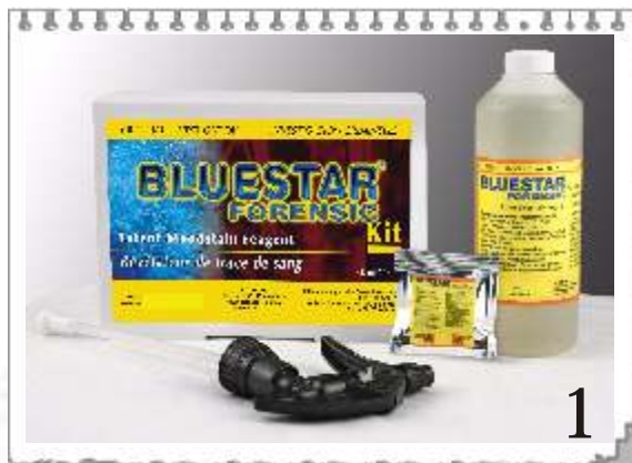
1 9746B : KIT BLUESTAR - PRÊT A L'EMPLOI

CETTE FORMULE CHIMIQUE DÉTECTE A LA VISION NORMALE DES TRACES DE SANG TRÈS PETITES S'UTILISE AVEC DES PHOTOGRAPHIES NORMALES. N'ALTÈRE PAS L'ADN.