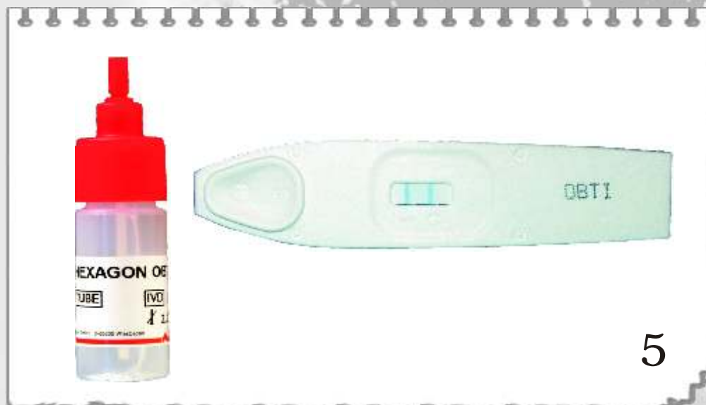
5 CE TEST PERMET DE PRÉCISER QU'IL S'AGIT D'UNE TRACE DE SANG HUMAIN 9748B : HEXAGON OBTI 24 TESTS 9788B : HEXAGON OBTI 6 TESTS