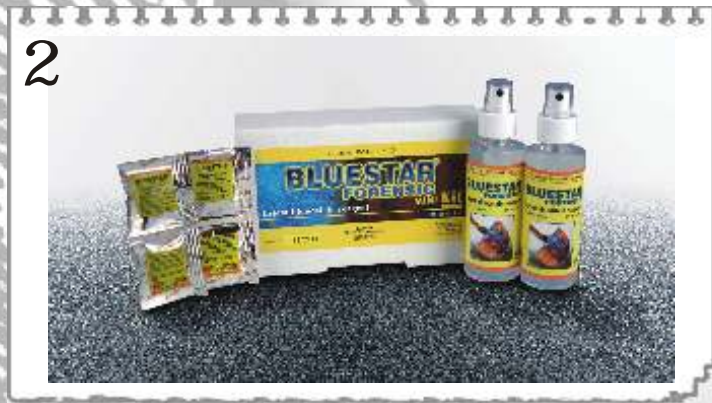
2 9783B : MINI-KIT BLUESTAR - PRÊT A L'EMPLOI